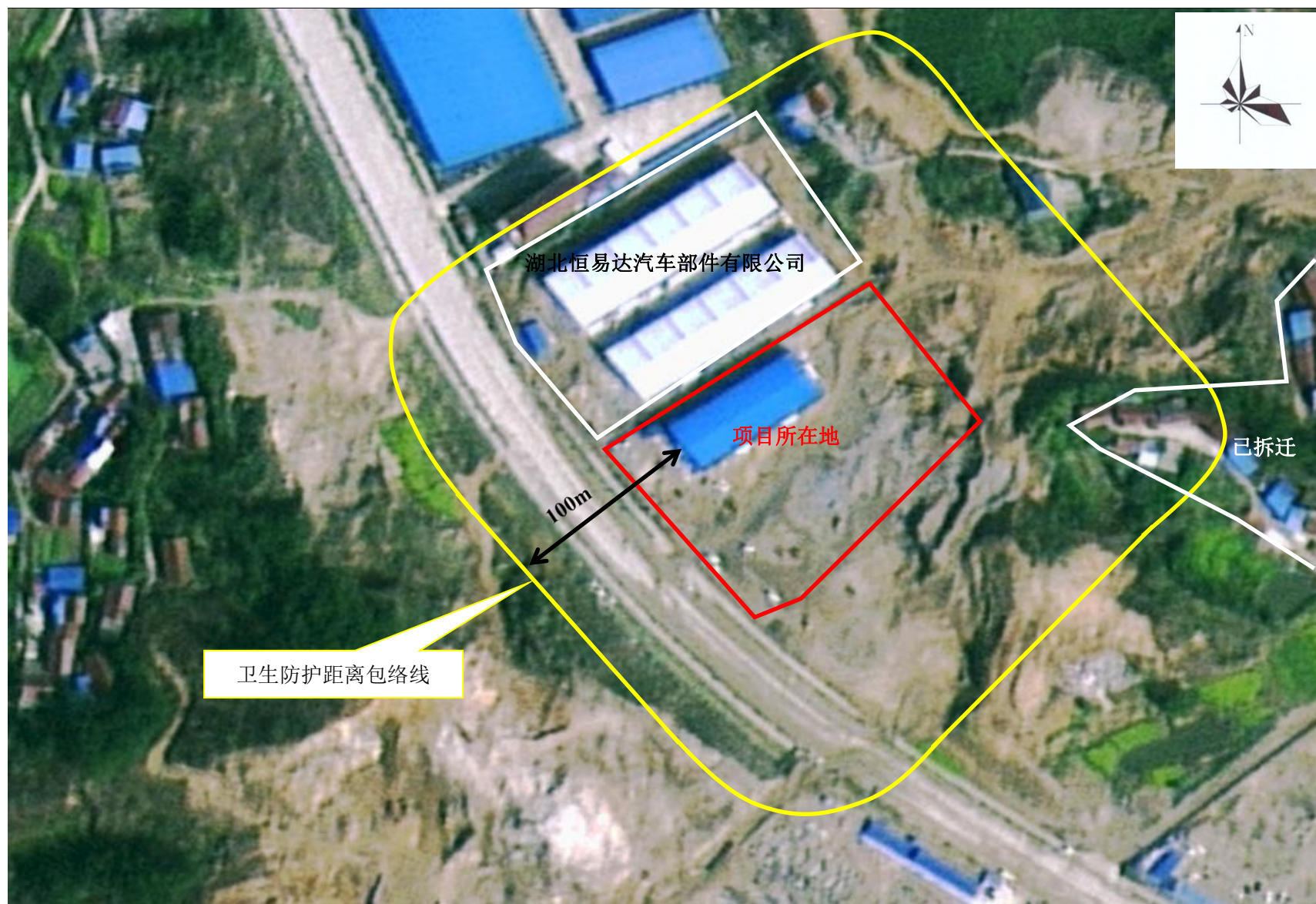
附图 5 项目卫生防护距离包络线图