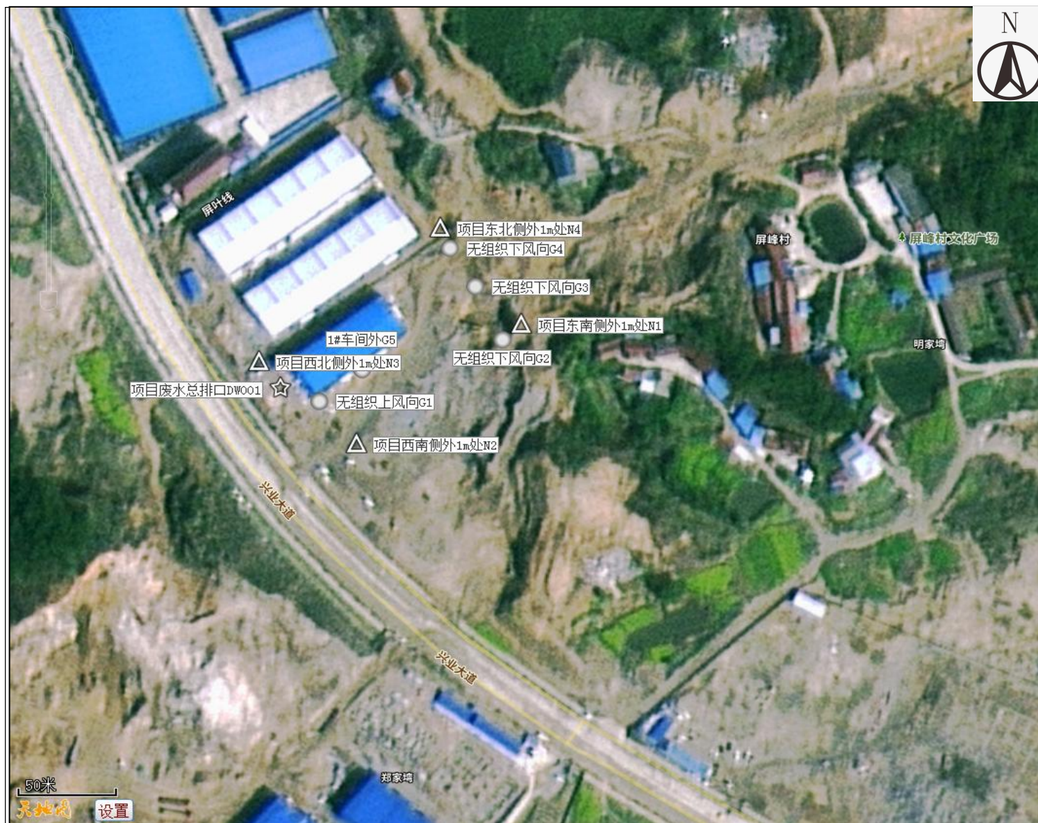
附图 4 项目监测点位图