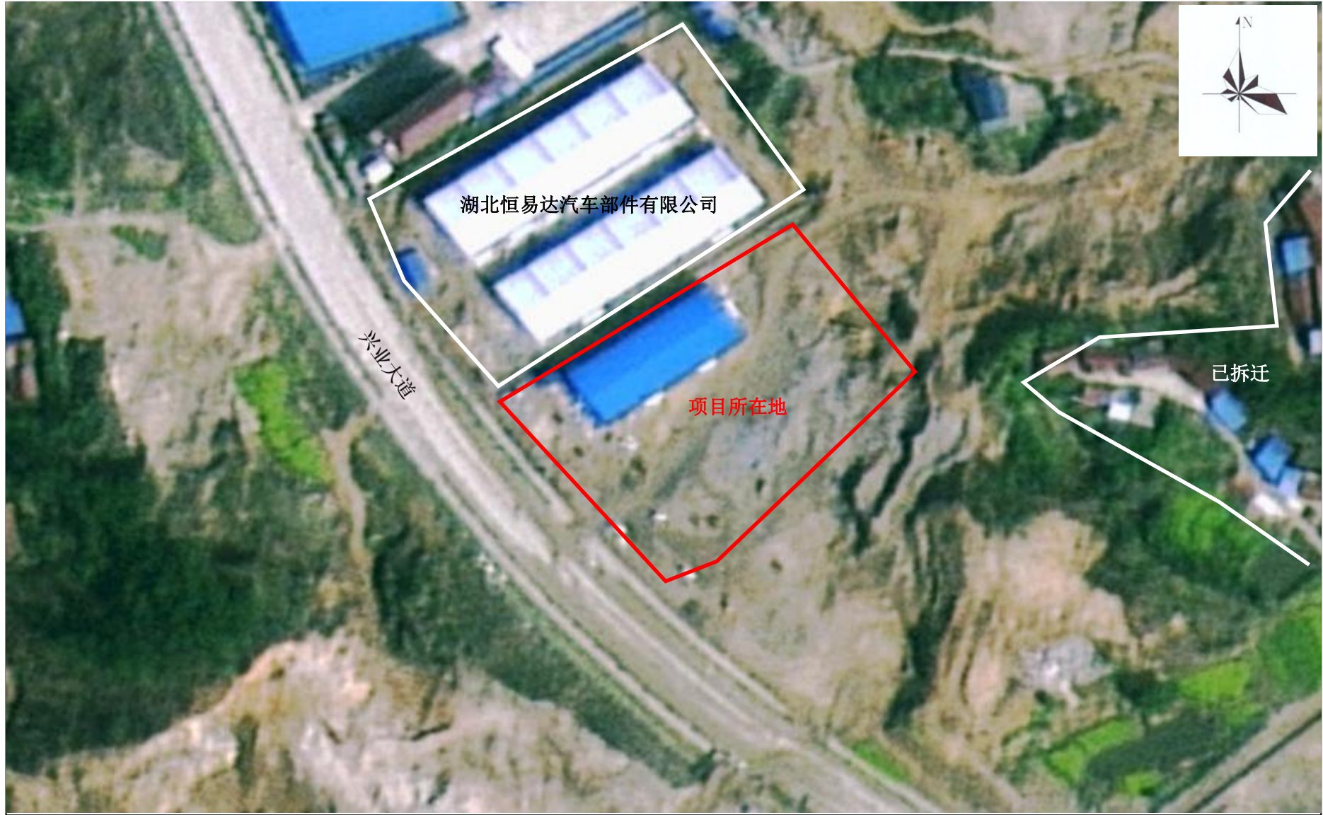
附图 2 项目周边关系示意图