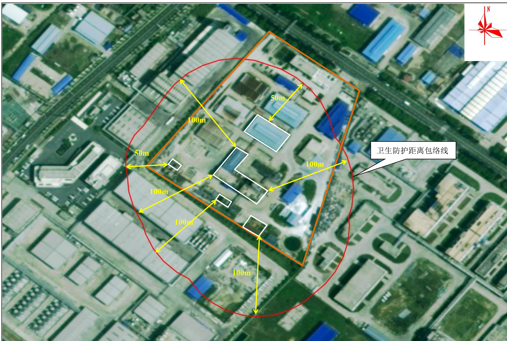
附图 7 卫生防护距离包络线图