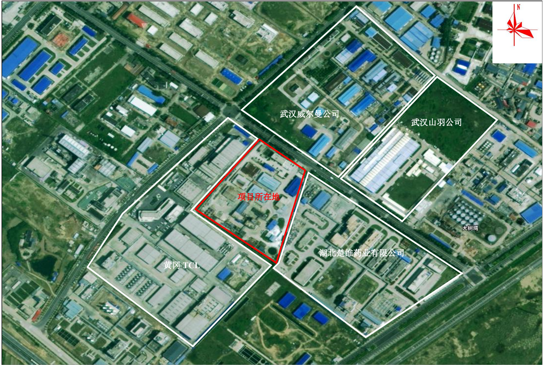
附图2 项目周边关系示意图