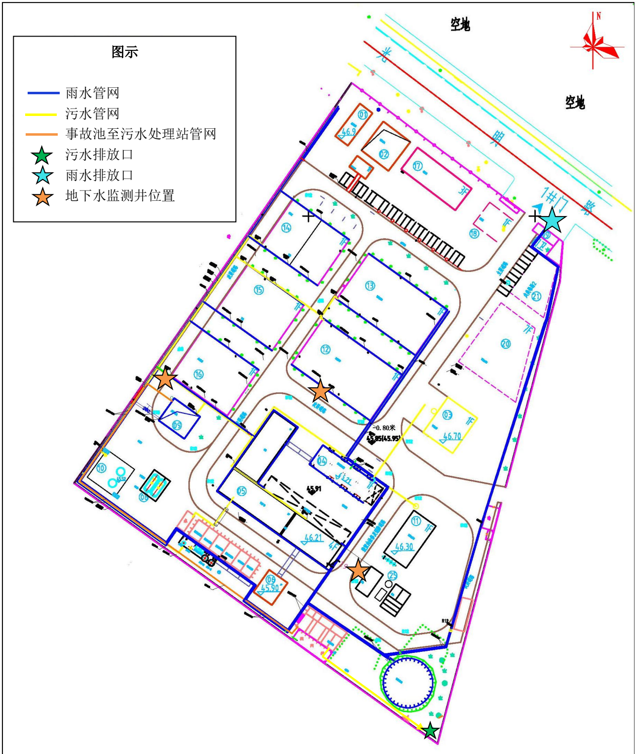
附图 4 项目厂区雨污管网图