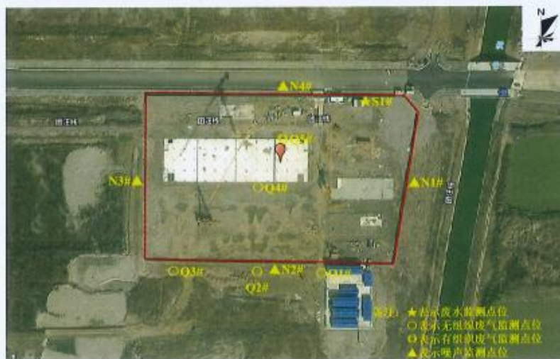
附图 1：监测点位示意图