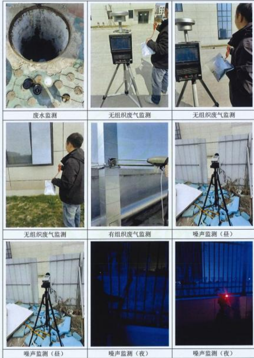
附图 2：现场采样照片