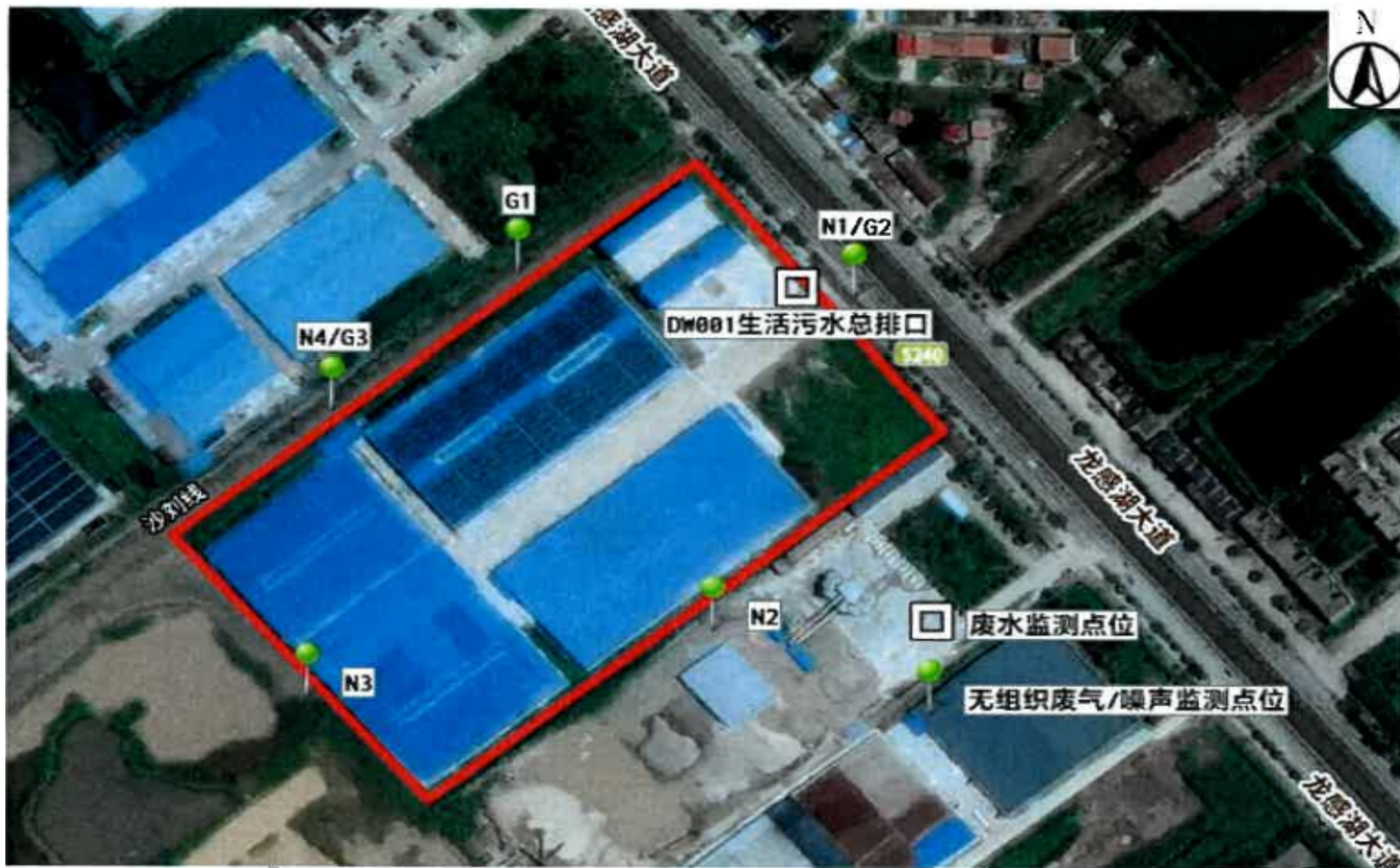
附图 4 项目验收监测点位示意图