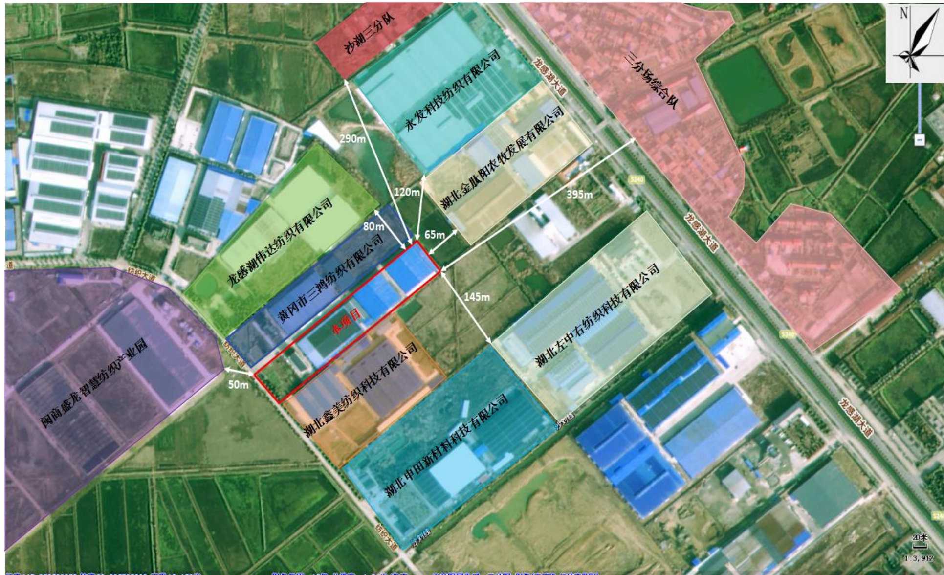
附图 2 项目周边环境关系示意图